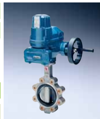
Inox non verniciato