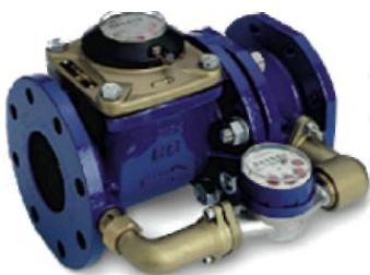
Рис. 1 Лічильник води MWN / JS-S