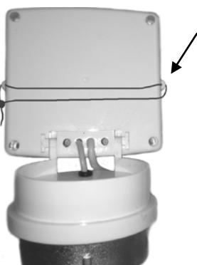
Рис.3 – Пломбирование вычислителя при выпуске из производства или поверки