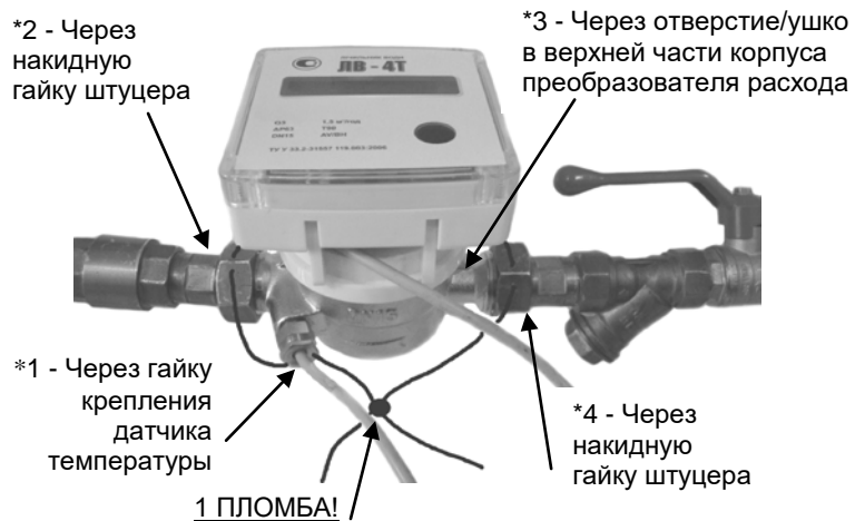
Рис.4 – Пломбирование после монтажа на трубопроводе