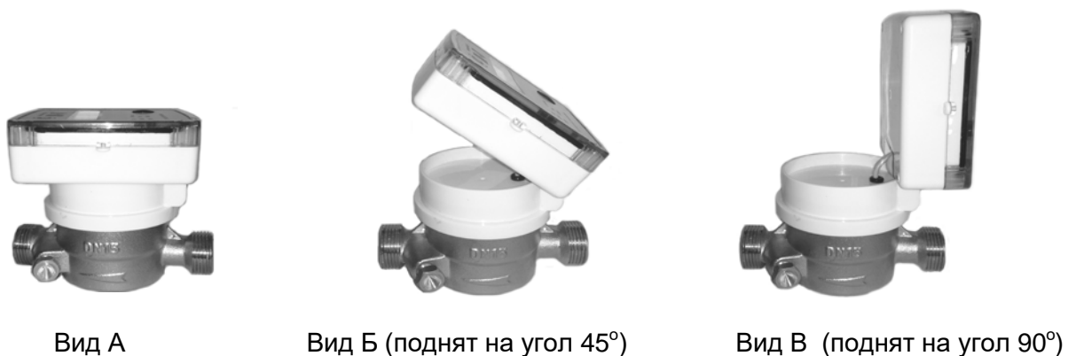
Рис.1 – Фиксация вычислителя (под разным углом наклона) на преобразователе расхода (Вид А, Б, В)

Вычислитель можно фиксировать под разным углом наклона (0...90°) относительно преобразователя расхода, для удобства считывания показаний (Рис.1).