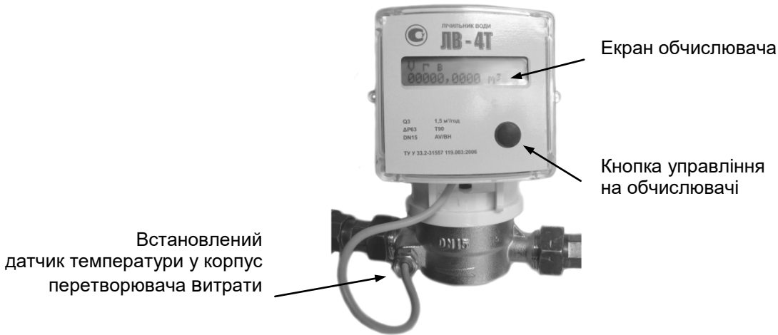
Рис.2 - Встановлений датчик температури і вид лицьової панелі обчислювача

6.4 Електроживлення лічильника здійснюється від літєвої батарейки. Напруга на полюсах батарейки залишається практично незмінною протягом усього терміну експлуатації, тому неможливо визначити її залишкову ємність з допомогою вольтметра. Літєву батарейку не можна підзаряджати та замикати накоротко.