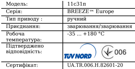
Таблиця 1. Характеристики