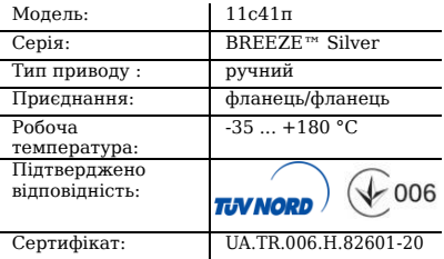
Таблиця 1. Характеристики