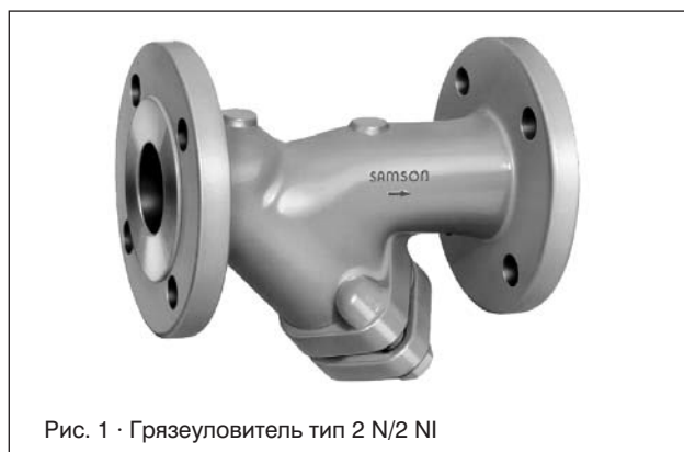
Рис. 1 · Грязеуловитель тип 2 N/2 NI

– фланцы со шпонкой / выступом / углублением – по запросу –