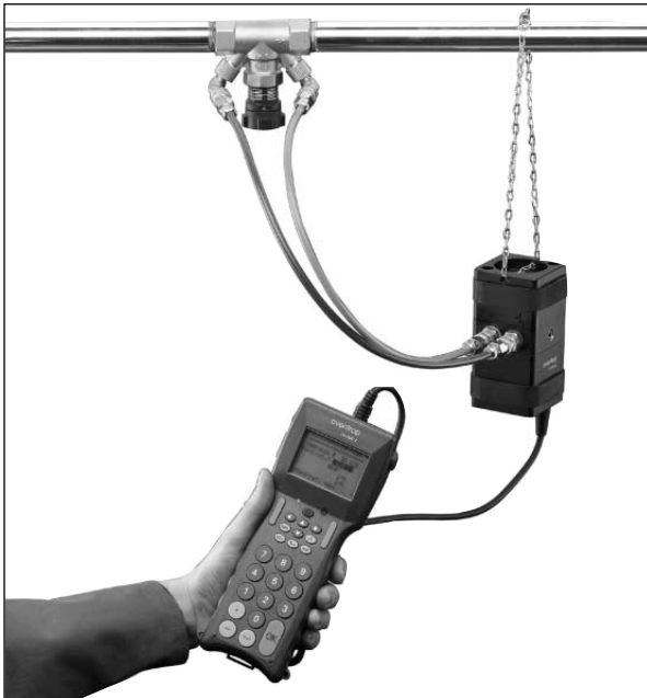
Durchflussmesscomputer Art.-Nr. 106 91 77

F. W. OVENTROP GmbH & Co. KG Paul-Oventrop-Straße 1 D-59939 Olsberg Telefon +49 (0)29 62 82-0 Telefax +49 (0)29 62 82-400 E-Mail mail@oventrop.de Internet www.oventrop.de