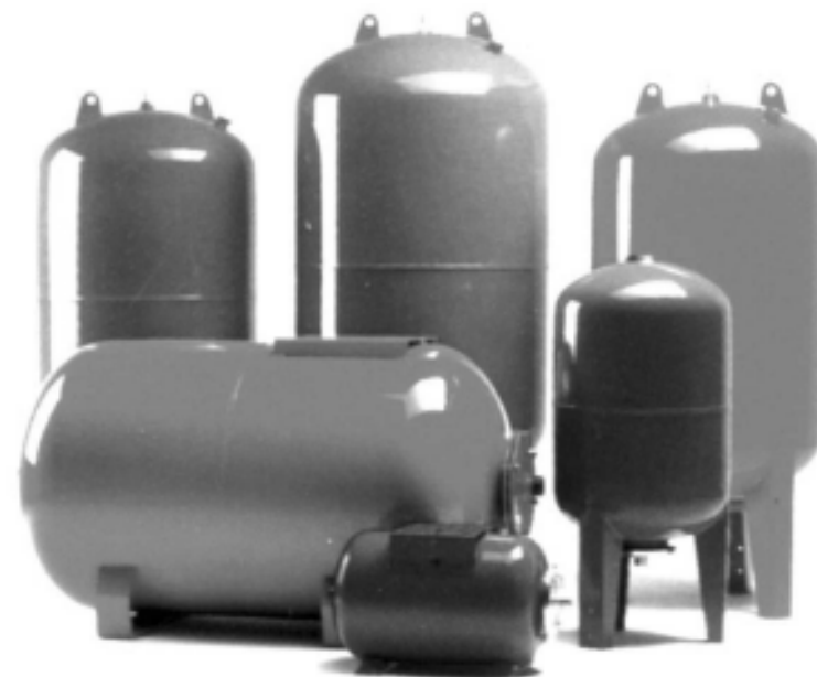
Гидроаккумулирующие мембранные баки ULTRA-PRO, WATER-PRO